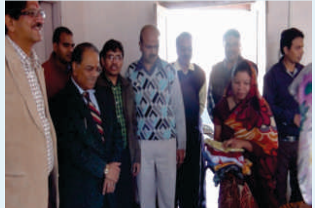
प्रबंध निदेशक/डीएफसीसीआईएल जन शिक्षण संस्थान, खरवा (राजस्थान) द्वारा चलाए जा रहे पाठ्यक्रम में प्रशिक्षुओं से बात चीत करते हुए