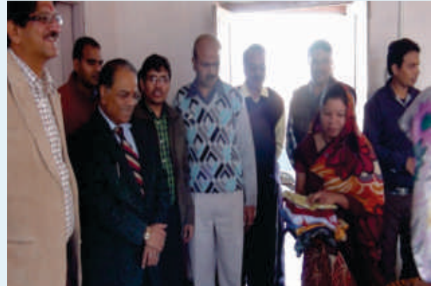
MD/DFCCIL's inspection of training classes at ITI, Beawar (Rajasthan)

To support the institute as well as students, some equipments such as, drilling/welding machines, drawing boards, tables, etc. have been provided by DFCCIL.