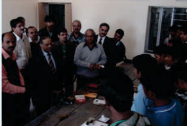
MD/DFCCIL interacting with trainees, course by Jan Shikshan Snsthan at Kharwa (Rajasthan)

As a total 891 PAPs were trained in the above job oriented trades with allotted amount of ₹ 18 Lakh for CSR in 2012-13.