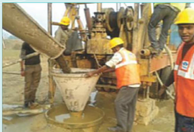
Concreting in Pile of Major Bridge 304