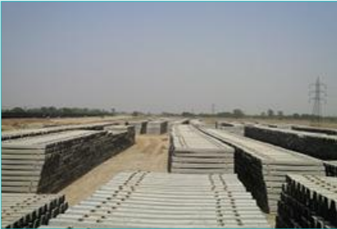
भाऊपुर यार्ड में स्लीपरों की आपूर्ति