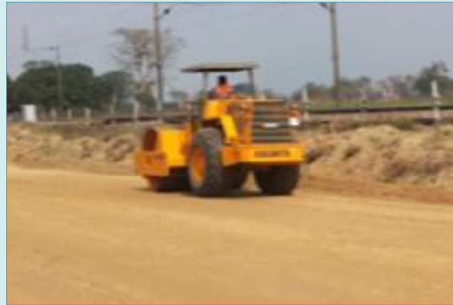
सी पी 101 में तटबंध परत की रोलींग