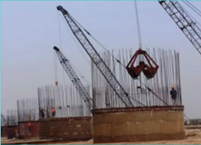
सोनपुल – कुंओं की खुदाई