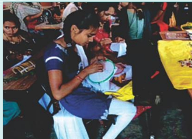
PAPs are being imparted vocational training of Dress Making