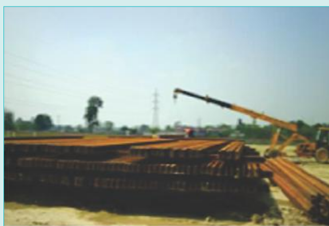
Rails unloaded in Maitha Yard