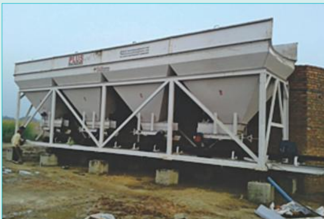
Pug Mill for blending blanket material Near Bhaupur