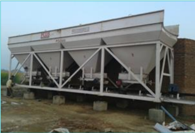
भारुपुर के निकट सामग्री मिश्रण की चक्की