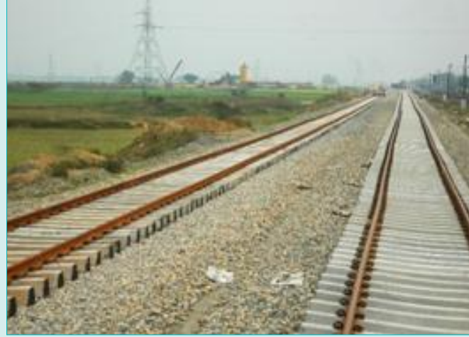
ट्रेक लिंकिंग मुगल सराय – सोननगर