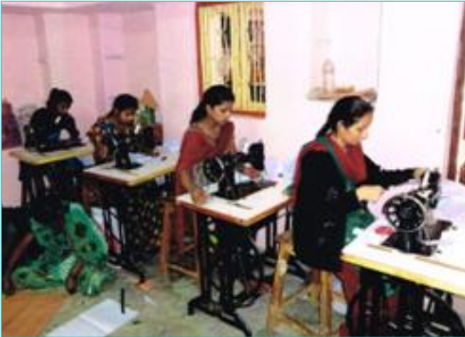
परियोजना प्रभावित व्यक्तियों को काटने और सिलाई का व्यावसायिक प्राशिक्षण दिया जा रहा है ।