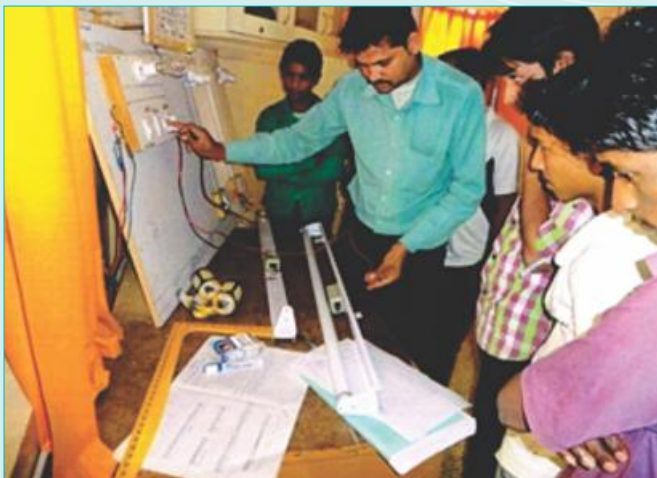
PAPs are being imparted vocational training of Electrician