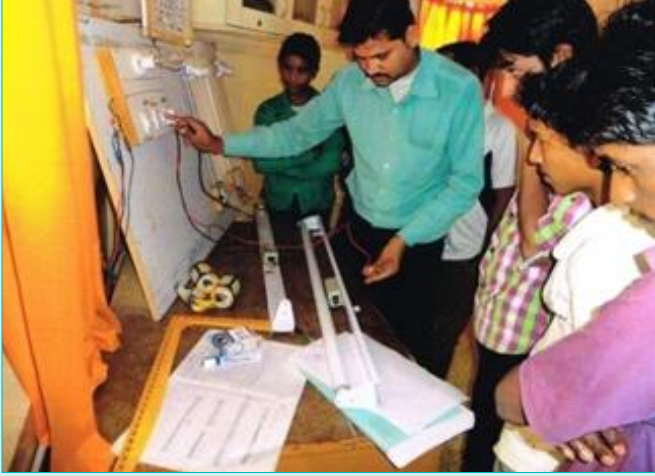
परियोजना प्रभावित व्यक्तियों को बिजली मिस्त्री का व्यावसायिक प्राशिक्षण दिया जा रहा है ।

कंप्यूटर साक्षरता के क्षेत्र में परियोजना प्रभावित व्यक्तियों की क्षेत्रों में सभी सामान सहित 23 डेस्कटॉप कंप्यूटरों को उपलब्ध कराया गया ।