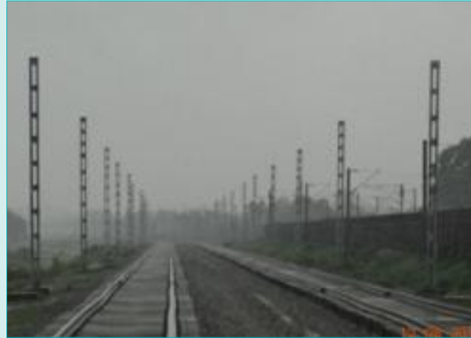
ओ एच ई मास्ट निर्माण- मुगलसराय-सोननगर