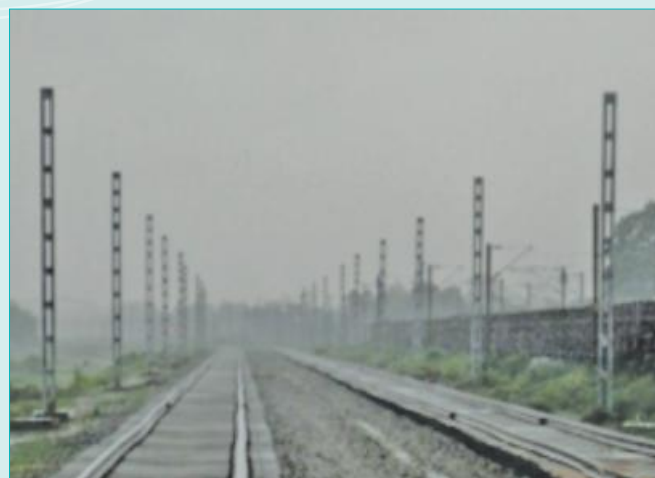
OHE mast erection- Mughalsarai-Sonnagar