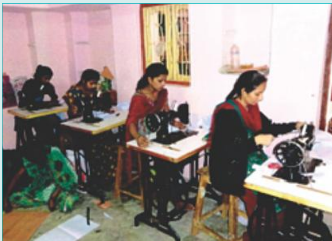
PAPs are being imparted vocational training of Cutting & Tailoring.