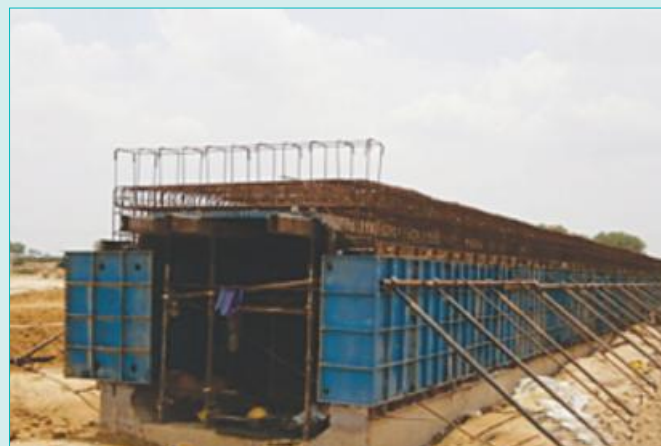
Minor Bridge works in progress near Tundla