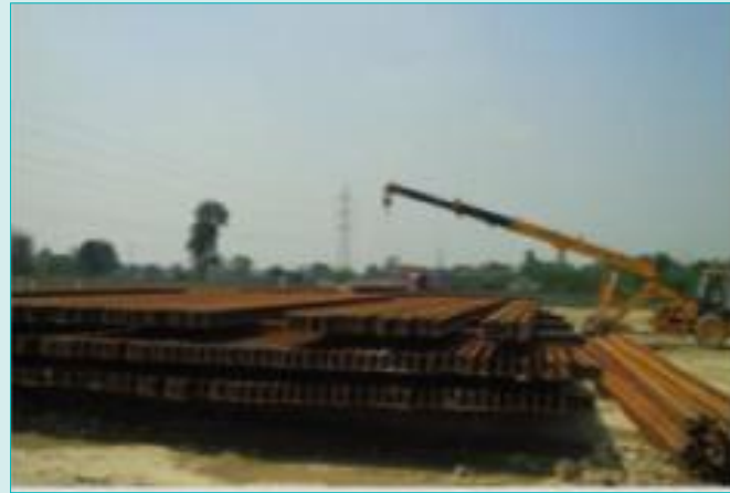
मैथा यार्ड में रेलों की उतराई