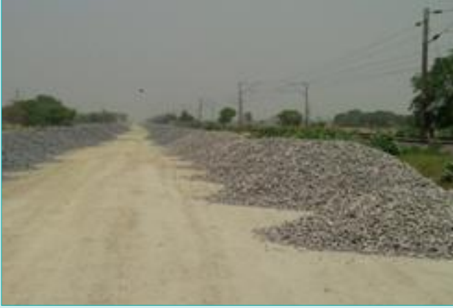
सी पी 101 में गिट्टी आपूर्ति