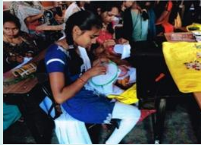
परियोजना प्रभावित व्यक्तियों को ड्रेस बनाने का व्यावसायिक प्राशिक्षण दिया जा रहा है ।