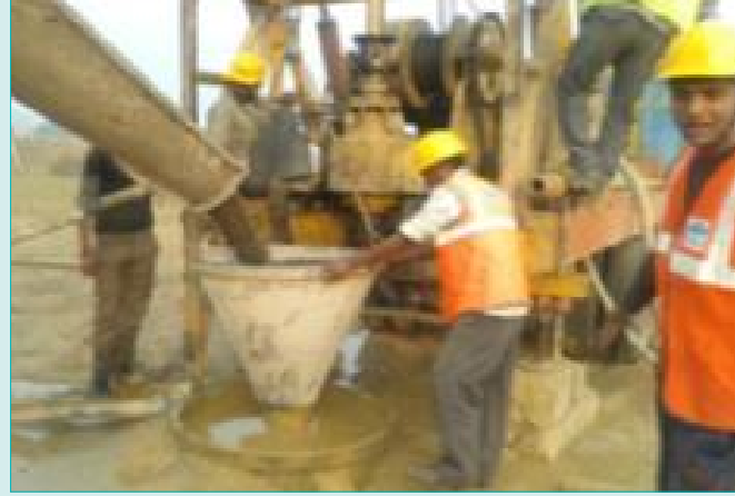
बड़े पुल 304 के आधार की कन्क्रीटिंग