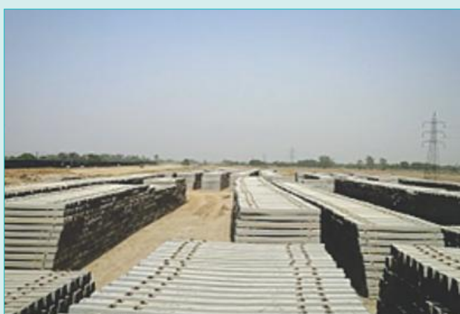
Supply of Sleepers in Bhaupur Yard