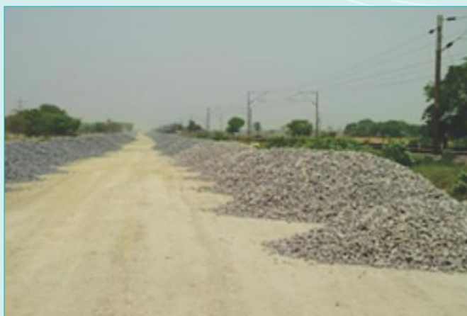
Ballast Supply in CP 101