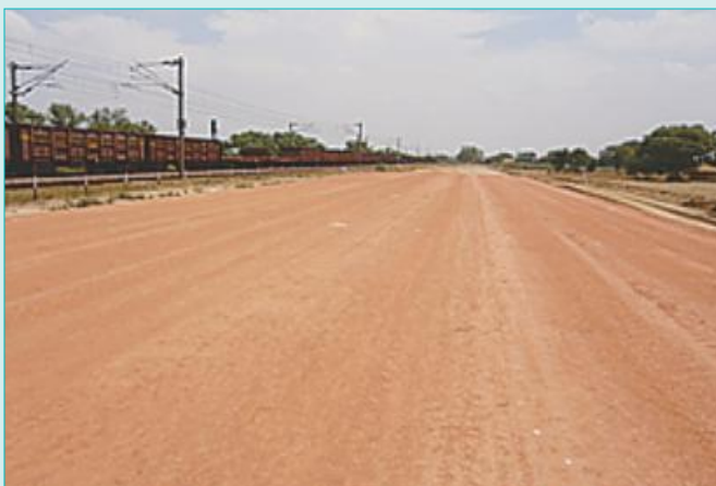
Completed Bank near Tundla