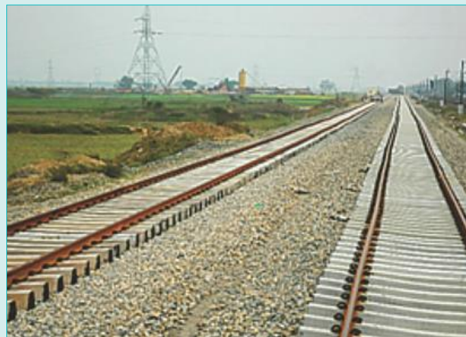
Track linking: Mughalsarai - Sonnagar