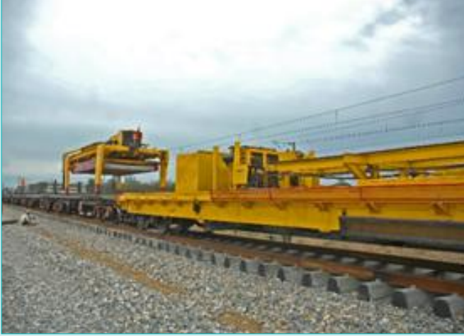
ट्रेक लिंकिंग मुगल सराय – सोननगर