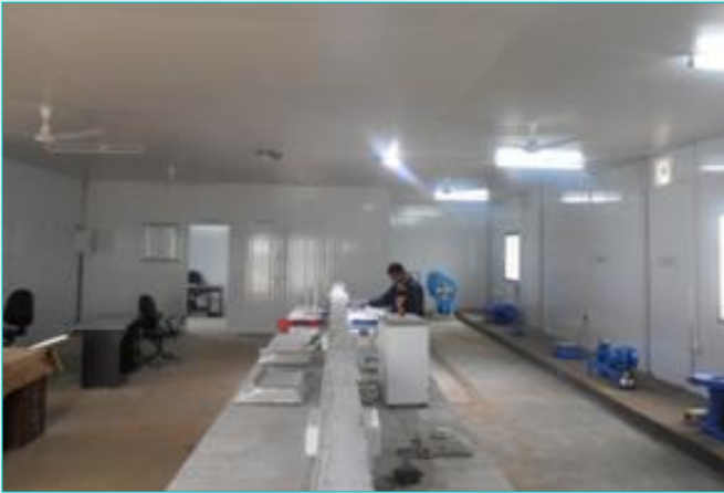
कानपुर में फील्ड प्रयोग शाला