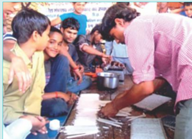
PAPs are taking training in the field of Box & Candle making

In addition to above, some equipment's/tools including swing machines have been provided by DFCCIL to support the institute as well as students.