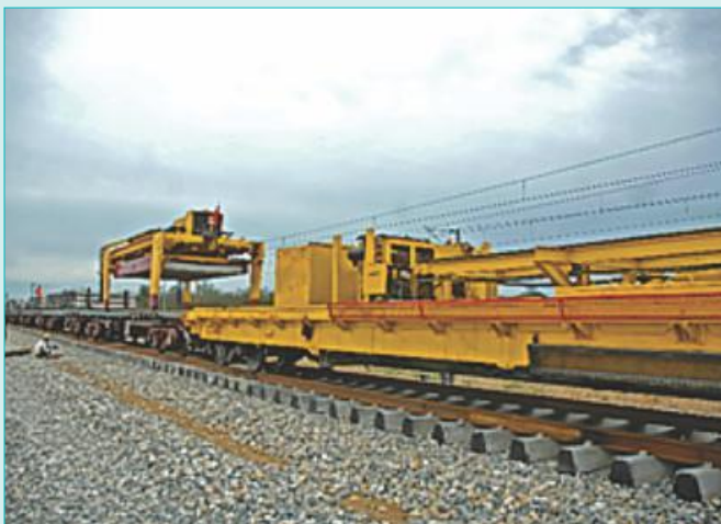
Track linking: Mughalsarai - Sonnagar