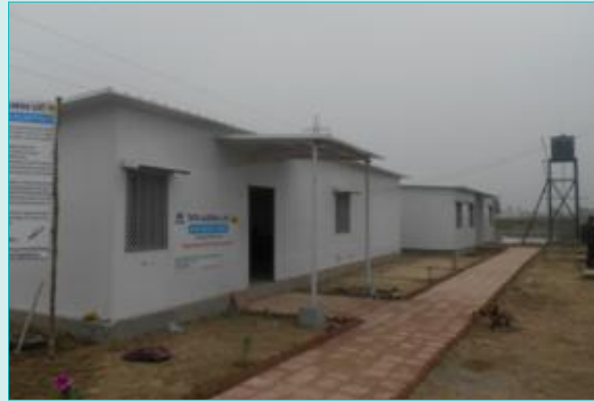
अलीगढ़ के निकट सेटेलाइट कार्यालय