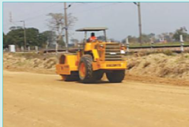
Rolling of embankment layer In CP 101