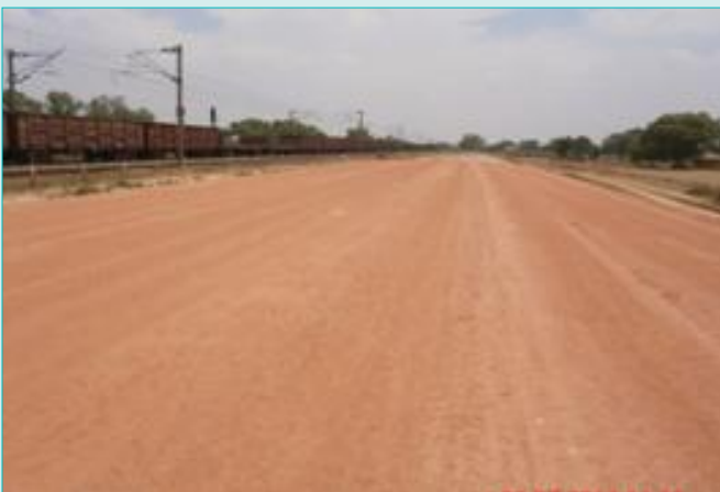
ढूंडला के निकट पूरा किया गया तट