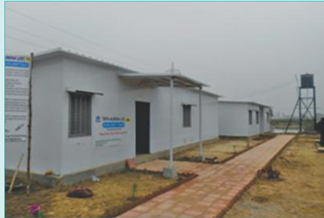
Satellite Office near Aligarh