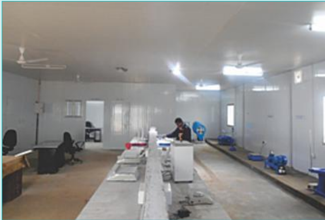
Field Laboratory at Kanpur