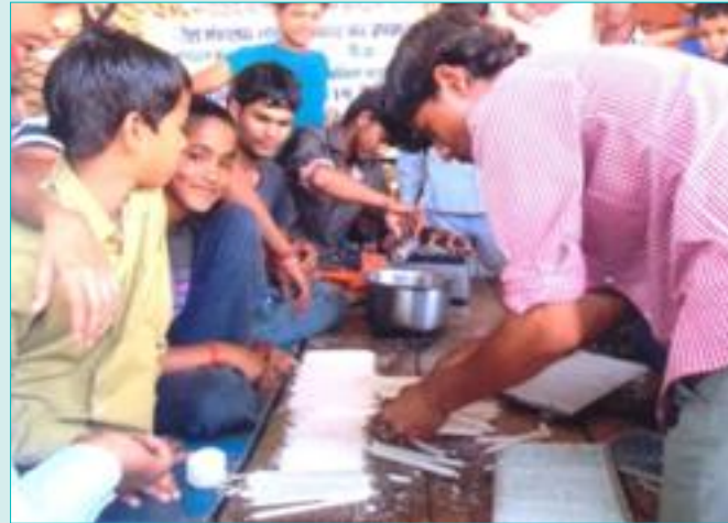
परियोजना प्रभावित व्यक्ति को बाँक्स और मोमबत्ती बनाने का प्राशिक्षण ले रहे है ।