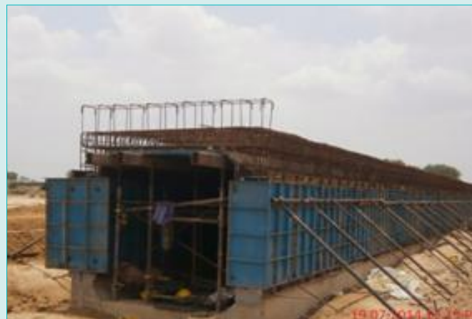
ढूंडला के निकट छोटे पुल का कार्य प्रगति पर