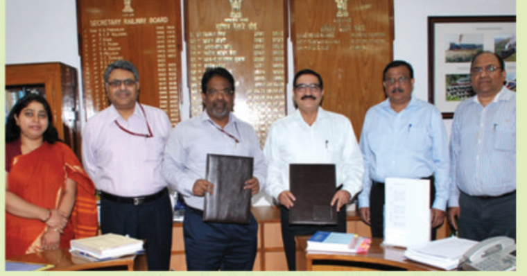
एमओयू पर हस्ताक्षर के दौरान उपस्थित रेलवे बोर्ड एवं डीएफसीसीआईएल के अधिकारी गण डीएफसीसीआईएल में कार्य करने के लिए रेलवे अधिकारियों की कार्यकाल के आधार पर प्रतिनियुक्ति में भी मदद करेगा।

यह एमओयू डीएफसीसी परियोजनाओं की विभिन्न महत्वपूर्ण गतिविधियों के लिए लक्ष्यों को निर्धारित करता है। इसके अतिरिक्त यह एमओयू परियोजना के कार्यान्वयन के लिए यथोचित निधियों को समयबद्ध जारी करने, भूमि अधिग्रहण और