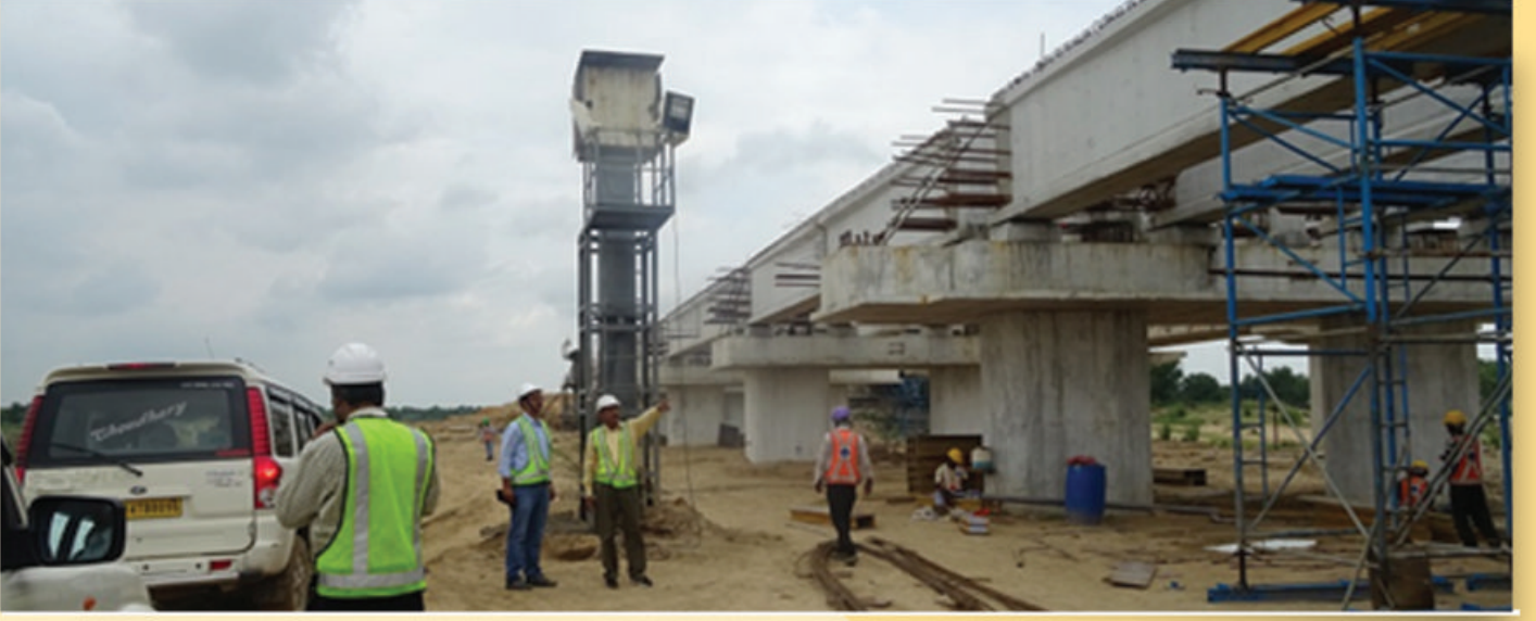
पश्चिमी डीएफसी के रेवाड़ी-इकबालगढ़ में जयपुर के पास पुल निर्माण का कार्य प्रगति पर