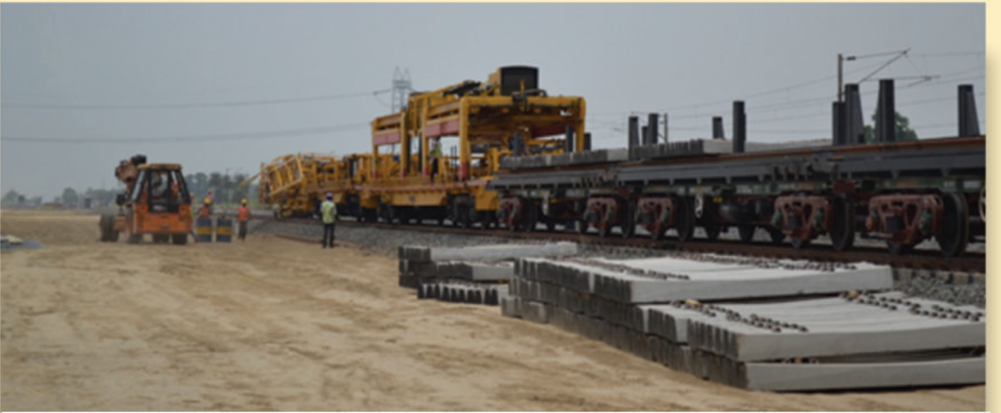
पूर्वी डीएफसी के खुर्जा-भाऊपुर सेक्शन में भदान के पास ट्रैक लेइंग का कार्य प्रगति पर

डेडीकैटेड फ्रेट कोरीडोर कॉर्पोरेशन ऑफ इंडिया लिमिटेड द्वारा प्रकाशित | कृपया पत्र-व्यवहार इस पते पर करें: संपादक, डीएफसी समाचार, चतुर्थ तल, प्रगति मैदान, मेट्रो स्टेशन भवन परिसर, नई दिल्ली- 110001, फ़ैक्स 91-112345827, ईमेल: jkjin@dfcc.co.in, rkhare@dfcc.co.in वेबसाइट: www.dfccil.gov.in संपादक: जे.के. जैन, सह-संपादक: राजेश खरे