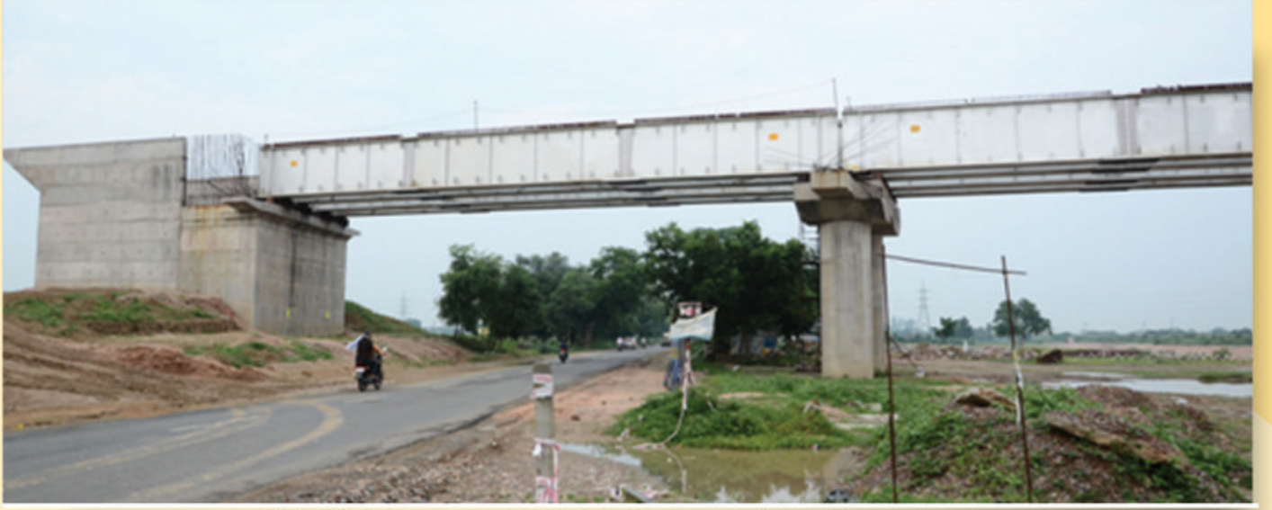
पूर्वी डीएफसी के खुर्जा-भाऊपुर सेक्शन में टूंडला के पास रेल प्लाइओवर निर्माण का कार्य प्रगति पर