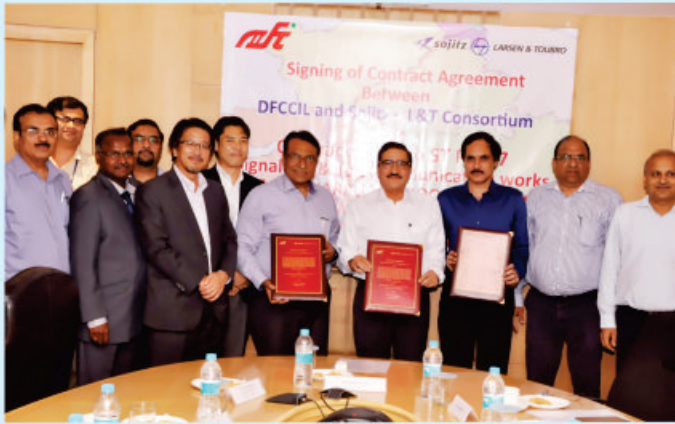
कॉण्ट्रैक्ट समझौते पर हस्ताक्षर के दौरान उपस्थित डीएफसीसीआईएल के अधिकारीगण एवं मेसर्स सोजित-एल एंड टी कन्सॉर्शियम के पदाधिकारी गण

डीएफसीसीआईएल ने पश्चिमी डीएफसीसी में निर्माण कार्य की गति को और तेज करते हुए एक बड़े कॉण्ट्रैक्ट समझौते पर हस्ताक्षर किया है। यह कॉण्ट्रैक्ट वडोदरा-जवाहरलाल नेहरू पोर्ट ट्रस्ट सेक्शन में